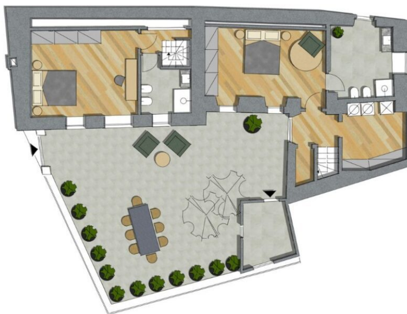
PLANIMETRIA PIANO TERRA