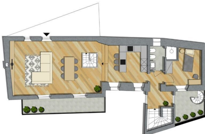
PLANIMETRIA PRIMO PIANO